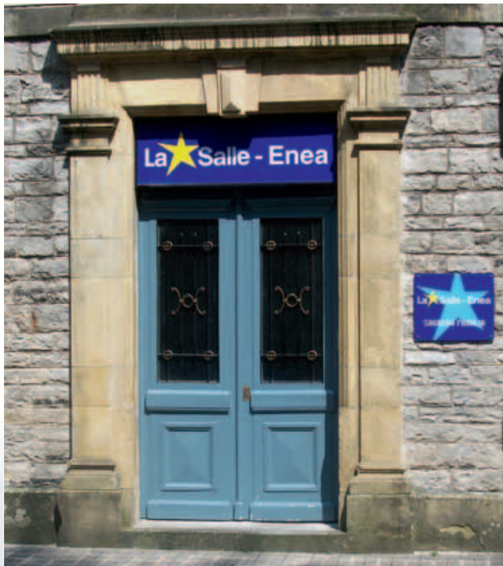
Irunen, La Salle Eneako nobiziaduan sartu zen 1948an

arriskua bateratzen ziren zeren herri honetako mutilek harrika hartzen zituzten kanpoko mutilak eta azunbre bat ardao ordaindu beharra izaten zuten bakerik izango bazen!