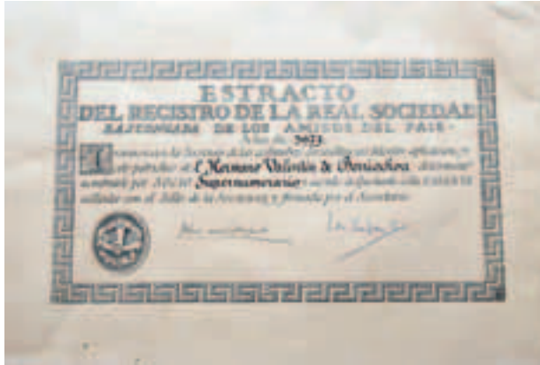
Real Sociedad Baskongada de Amigos del Pais-en bazkide agiria

astiroa izan naiz beti. besteak baino atzerago ni beti gauza guztietan