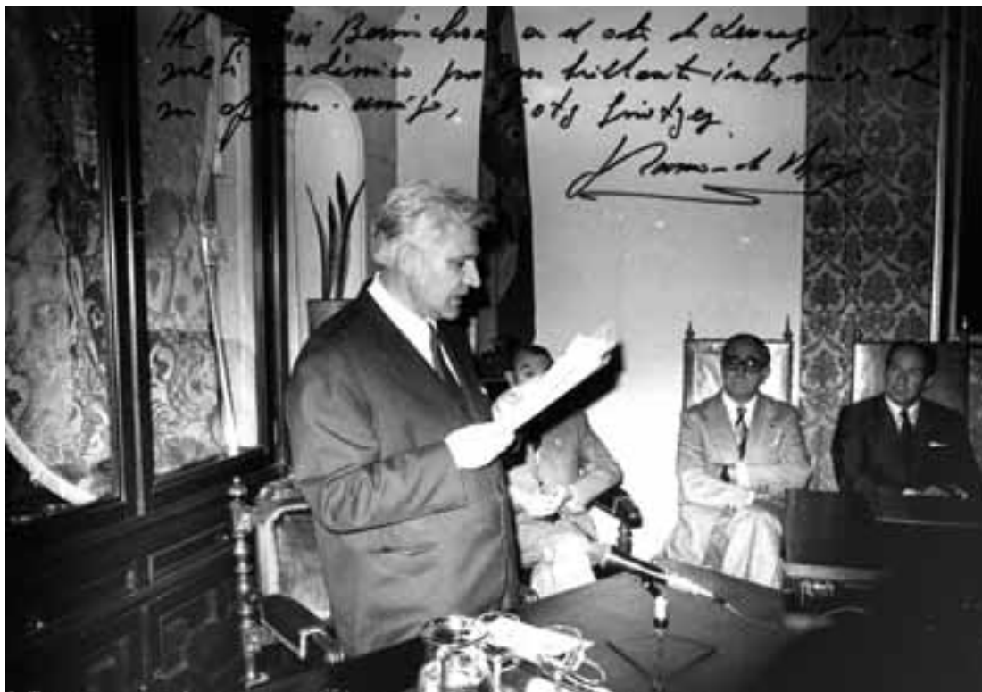
Durangoko udaletxean "Baskongada"ko sarrera hitzaldian