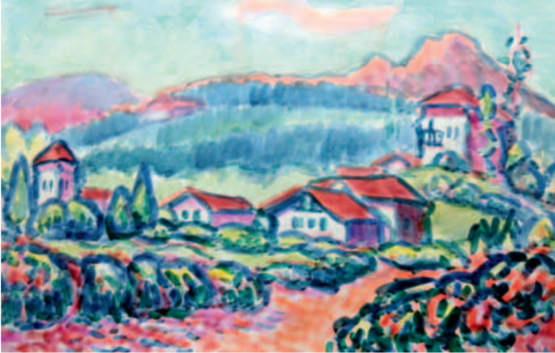
Izurtzako herritxoa Mugarako haitz urkuluaren azpian, Tontorraren pintzelen arabera