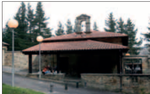
Izurtzako Erdoitzako Andra Maria eta hilerria Bitañora bidean

Oiztik Anbotora Durangoaldia Lurralde hontan dago Nere arimia Erortzen naizenian Lurra hartzen dodanien Maitatzen jarraiko zaittut Betiko bizian.