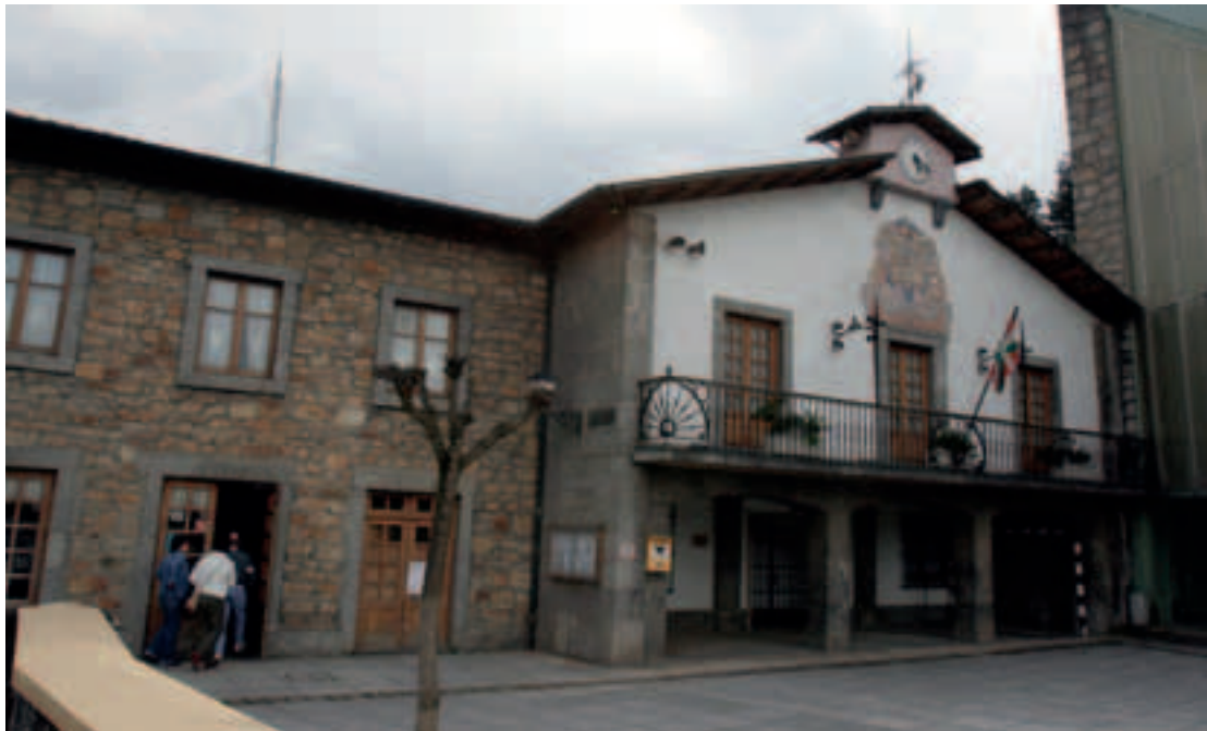
Izurtzako udaletxe apal eta dotorea