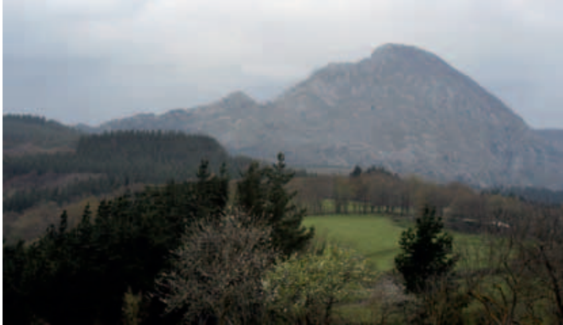
Mugarren altzoan Bitáño