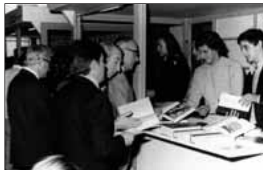
Andra Mariako elizpeko azokan liburu eta adiskide artean