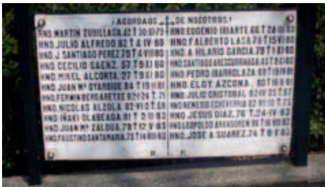
Bere erlijioso anaia kideekin batera oroitarrian, Irunen

Oiztik Anbotora Durangoaldia Hemen sustraitu nintzan Nere gaztedian Zuhaitzaren Legian Jarrai aurrerantzian