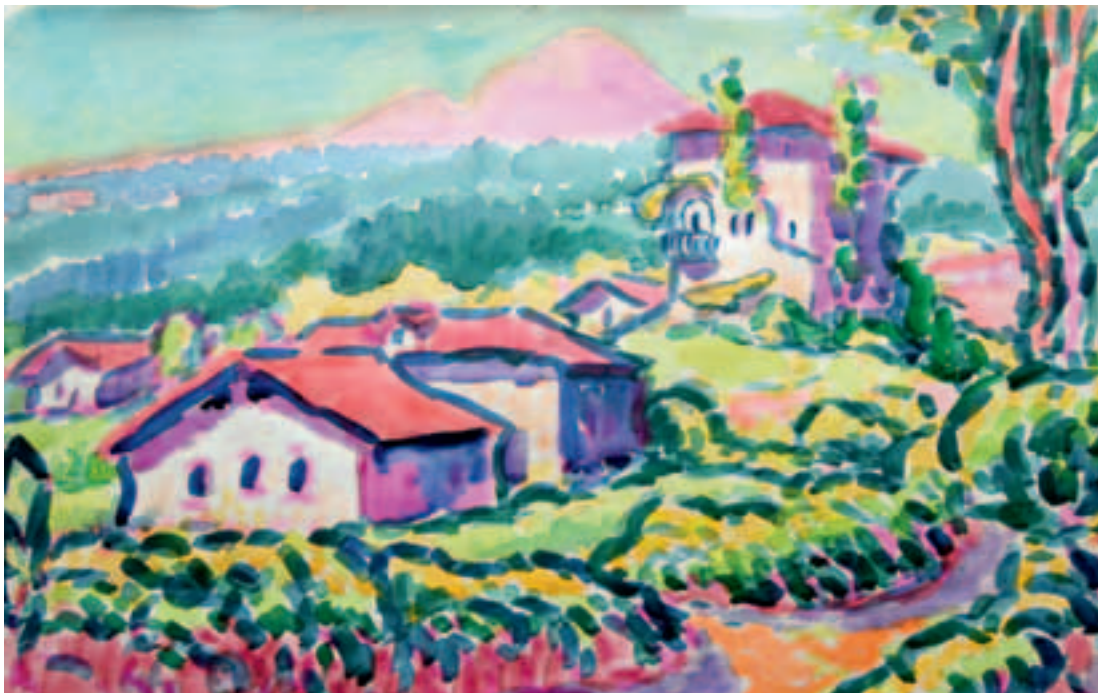
Izurtzako txoko ezagunak bere barruko kolorez margotuak