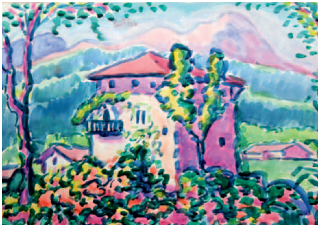
San Nikolas parrokia, Izurtzan, Tontorra artistaren ikuspegitik

Orain arte legez, egin beharrekoak egin eta han-hemen argitaratuko ditu bere lanak. Mensajero argitaldariaren eskutik datozkigu Hirugarren atalak 78an, Ipuinak 78an eta Ipuinak II 80an . Lehentxeago, 1971n Bigarren atalak argitara emana du Kuliska Sortan.