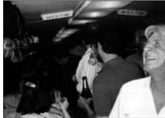
Paristik Tbilissirako (Georgia) bidean, hegazkinean

jasan dantza horiek gaizki dantzatuak izatea. Ez dezake jasan aureskua gaizki dantzatzea, edo ongi dantzatzen ez dakiten hurrei dantza araztea publiko baten aitzinean. Dantza zailak badira ere, gaur egun Gipuzkoan eta Bizkaian dantzari bikainak badirela uste du.