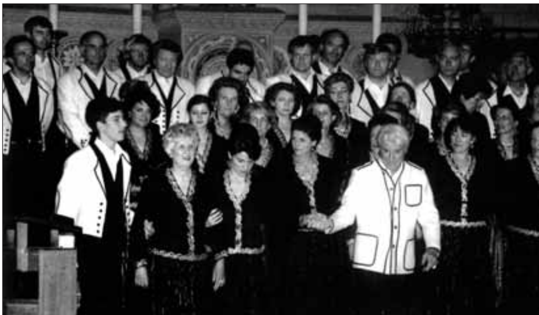
Kontzertua Asnieresen (Frantzia), 1992ko maiatzaren 21ean