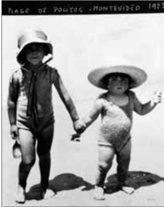
Bere arrebarekin hondartzan