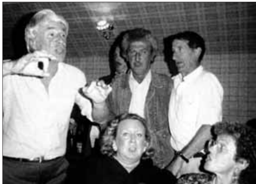
Euskal Herriko eta Georgiako ahotsak. Oihanburu ezkerrean