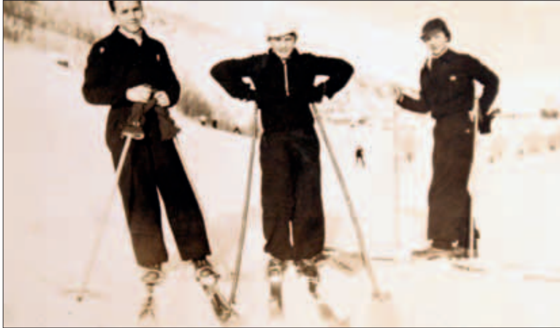
Eskiatzen 15 urterekin