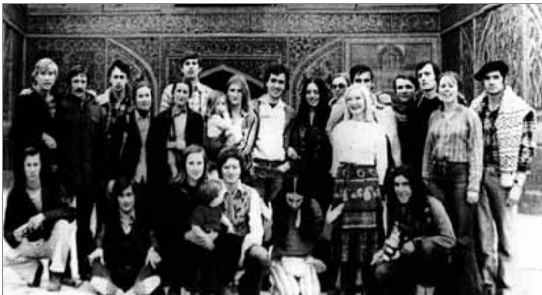
Iranen, 1977ko otsailean. Oihanburu zutik, ezkerretik hasita lehena