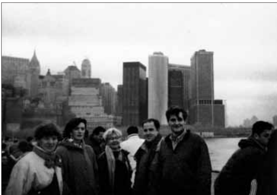
Oihanburu New Yorken, 1993an

Dirua ez da inoiz gustukoa ukan duen helburua, Oihanbururentzat. Adinean gora joanik ere, lerdin eta alai bizi da. Dantzarekin, kantuarekin eta euskararekin lotura atxikitzeagatik pozik bizi da. Aitatxi alai bat da, eta harro dago alaba gazteenak haurrak ikastolan ezarri dituelako.