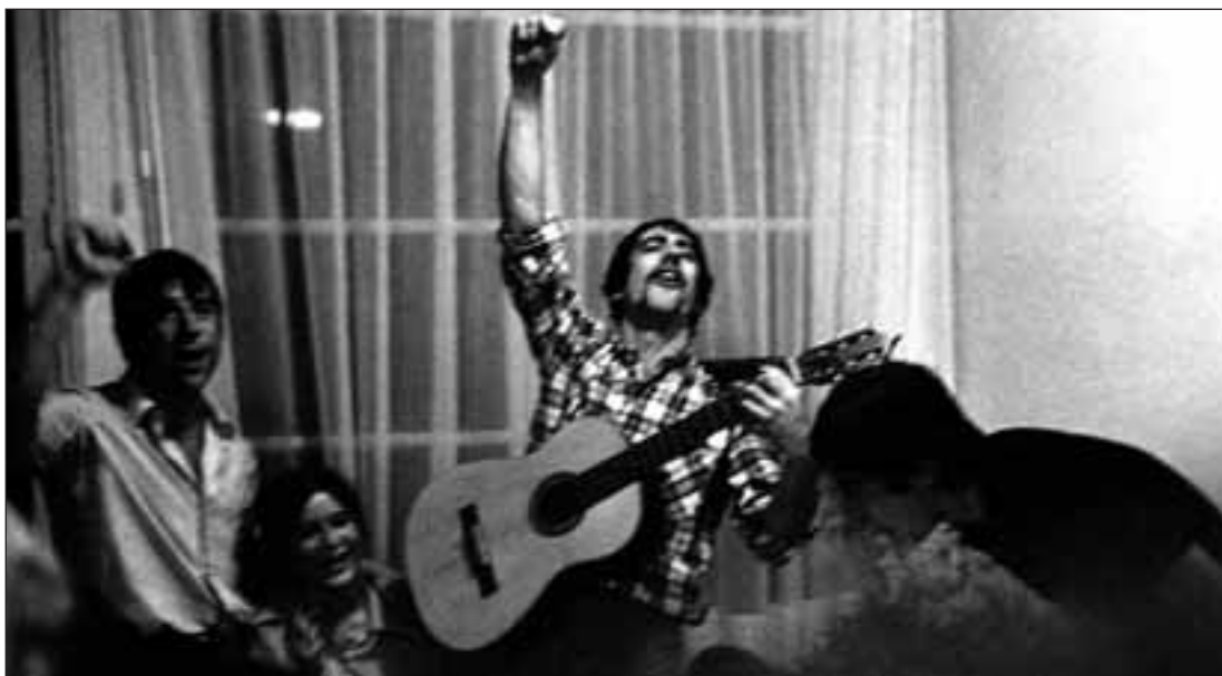
Parisen, ikusgarri baten ondotik, 1968ko ekainaren 15ean, 68ko maiatzaren giroa oraino sendi zela