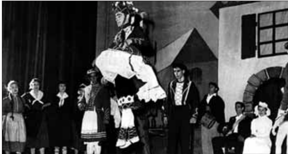
«Orhi pian» ikuskizuna, Miarritzeko udal kasinoan, 1954ko uztailaren 22an