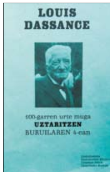
L.Dassanceren sortzearen ehungarren urte-mugakari atera liburuxka

Zutan agurtzen dut Aitoren seme bat. Zutan maitatzen dut Eskualdun suhar bat.