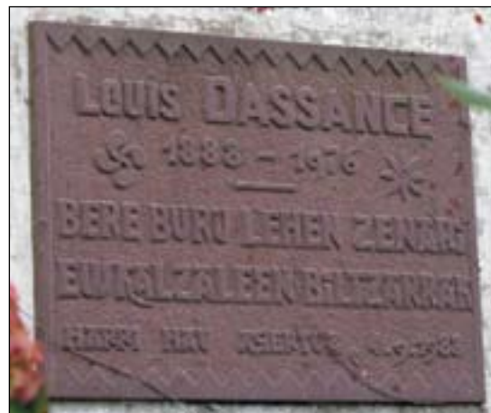
Bere sortzearen ehungarren urteburukari Eskualtzaleen Biltzarrak Uztaritzeko herriko etxean ezarri orroitarria

ez zituzten egun dituzten ahalak, bide, ur eta eletrika indarrak nahi izan ditu helarazi urrunean barreaturik zauden etxeetara. Bertzalde, baserrietara eletrika indarra eremaita helburu duen sindikataren sortzailetarik izan zen.