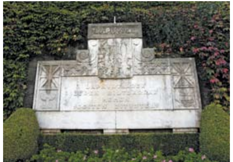
Uztaritzeko herriko etxe aintzinean den orroitarria. Hunek dio: «Lapurtarrek beren biltzarrak hemen egiten zituzten»