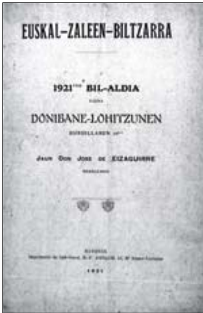
Euskaltzaleen Biltzarraren 1921ko bil-aldia