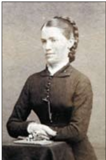
L. Dassance-n aitamak edo gurasoak