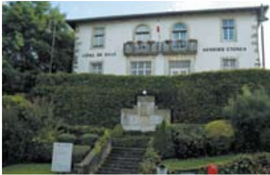
Uztaritzeko herriko etxea