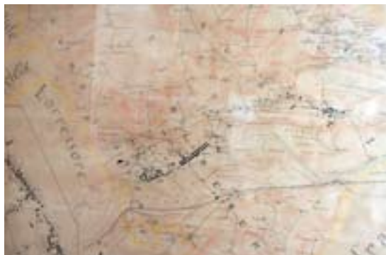
Uztaritze herriko kadastra edo mapa, L. Dassancek bere eskuz egin 1930 urtean

Indoeuropear deitu mintzairen aintzineko edo aurrekoa da Euskara. Leku izenak ur, erreka, mendi, haran eta abarren izenak denbora haien lekuko gelditu zaizkigun aztarnak dira. Ondotik agertu daitezke auzo eta etxe izenak. Euskarazko lehen