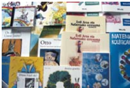
Ikas-ek publikatu zenbait eskuliburu eskoletako haurrentzat