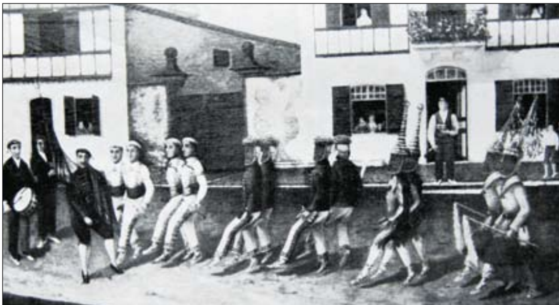
Uztaritzeko kaxkarotak, ihauterietan 1904 inguruan. Alexandre Casaubon-ek margotua 1925ean