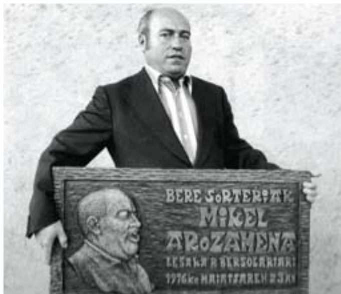
Lesakako herriaren saria hartuta

1976ko abenduaren 23ko goiz hartan ere, beti bezalaxe, zazpiak aldean joan zen lanera, haurtzarotik ezagutu zuen etxeko ospakizun gozoaren ametsa buruan zuela. Gabon eguna ez zen egun arrunta haren-