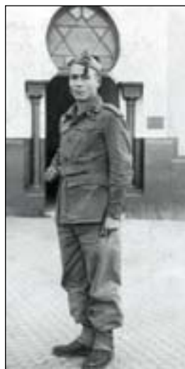
Larachen (Afrika) soldadu, 1952an

Hantxe egin zituen Larache (Afrika) aldeko lurralde erreterara soldadu joan zen arteko lan urteak, harik eta 1976ko abenduaren 23ko goiz ikaragarri hartan eguenero bezalaxe goizean goiz lanera joan eta Azpeitian hantxe bertan hil zen arte, ondoezak emanda.