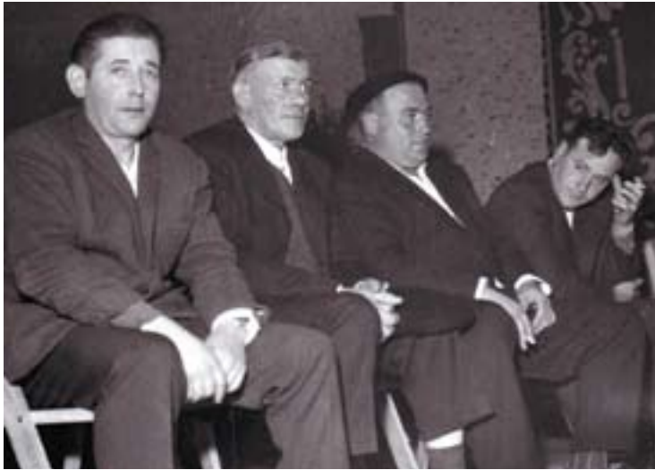
Lazkao Txiki, Uztapide, Arozamena eta Mugartegi, Donostian, 1965ean

plazaz plaza zeraman bizimodua eta bertso-lagunekin arian-arian ikasten zuena izan ezik. Haren aurreko eta garaiko guztiek izan zituzten bitarteko berdintsuak izan zituen, ez gehiago eta ez gutxiago.