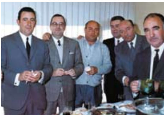
Migel, Iberdueroko lagunekin

Kalakari edo kontalari ona zen. Txistek edo ipuinak kontatzen, edota haurtzaroko kontu zahar eta pasadizoak esaten hastean,