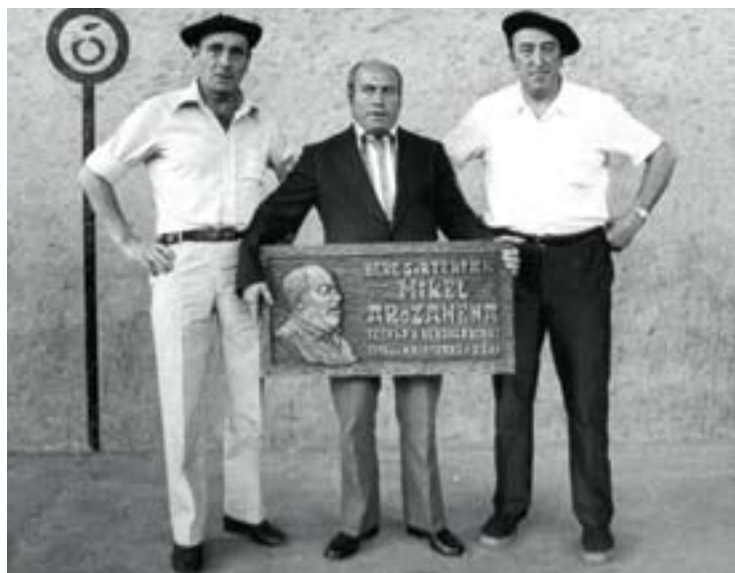
Lesakan saria jasotzen