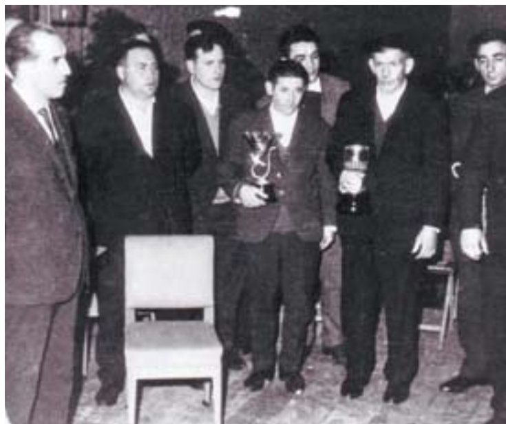
Donostian, 1965eko txapelketan