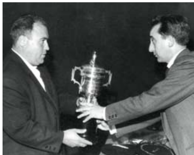
Nafarroako txapelketan Iruñeko Gayarren, 1966an