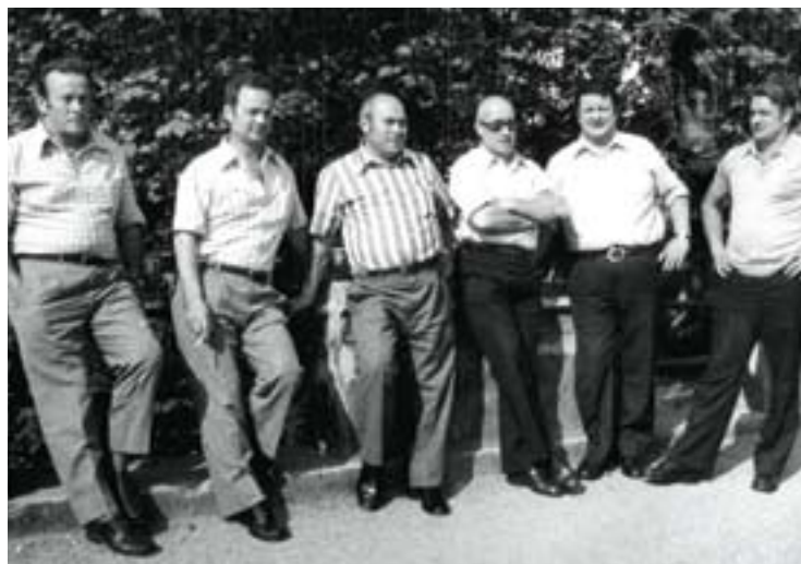
Migel bere lagunekin Lesakan

Hil eta handik hamabost egunera, Hondarribian omendu zuten berriro, 1977ko urtarrilaren 6an, Errege egunez. Urepeleko Xalbador handiarekin batera Arozamena zena omentzeko asmoz eta gogoz