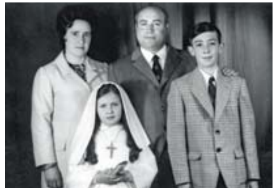
Alaba Mertxeren lehenengo jaunartzean