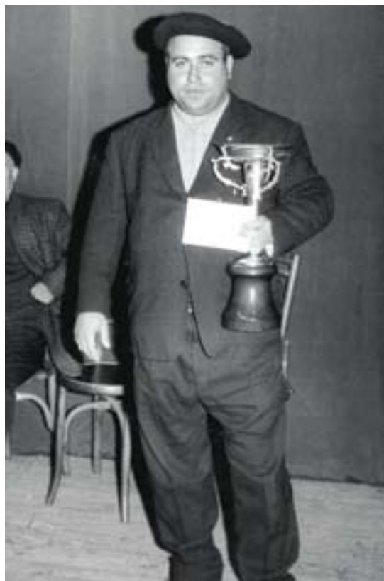
Nafarroako bertsolarien txapeldun, 1966an