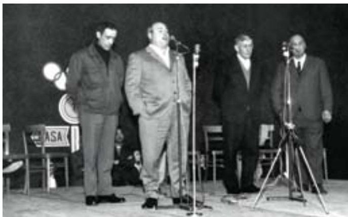
Galarretan (Hernani), 1971ko apirilean

Hala ere, aipatu sariketa horiez gainera, 1960an, 1962an, 1965ean eta 1967an egin ziren Euskal Herriko Bertsolarien Txapelketa nagusietan ere hantxe ikusi genuen «Gipuzkoako nafarra», serio eta emankor mikroaren aurrean, 1967ko ekainaren 11ko saioarekin Euskal Herriko eta Nafarroako txapelketak amaitu ziren arte.