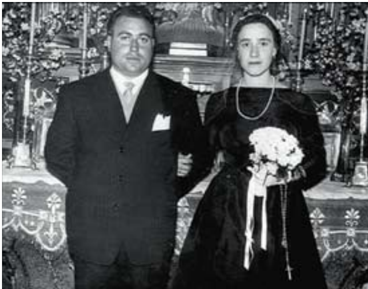
Leitzan, ezkontza egunean, 1958.05.31n

Etxean zegoenean guraso gozoa eta atsegina zela aitortzen dute alargunak nahiz haren semeak eta alabak ere. Eguneko lanak amaitzean agudo etxera etorri eta zenbat aldiz neska-mutilak altzoan hartuta, ipuin kontari, edota «Saltzen saltzen, txakur txiki baten karamelua...» eta antzeko euskal kantu ezagunak kantatzen zituzten elkarrekin! Ume txikiak zaindu eta gozo entretenitzen guztiz iaioa zela aitortzen dute, eta ez da gutxi.