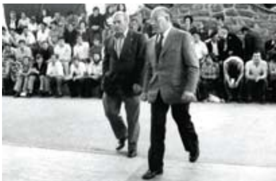
Lesakako omenaldian, 1976.05.23an