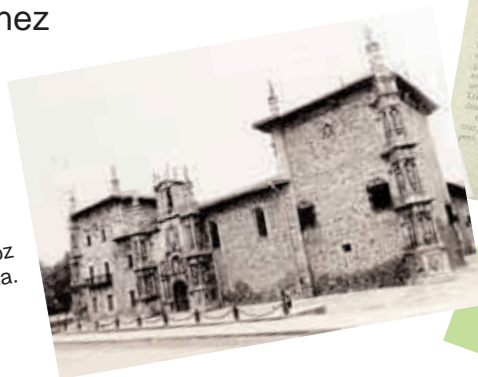
Pradere Garona Garaiko Arguinoz herritik etorritako abizena da.