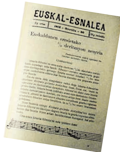
Euskal-Esnalea, Euskal Erria, Euskalerriaren alde.