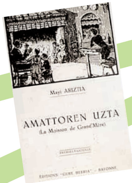
Amattoren uzta 1934 urtean argitaratzen hasi zen Gure Herria aldizkarian.