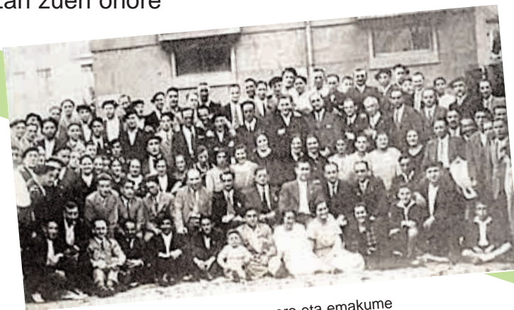
Gizonezkoak nagusi badira ere, gero eta emakume gehiago ari da idazletzan, 1930eko euskal idazleen argazki honek adierazten duenez.