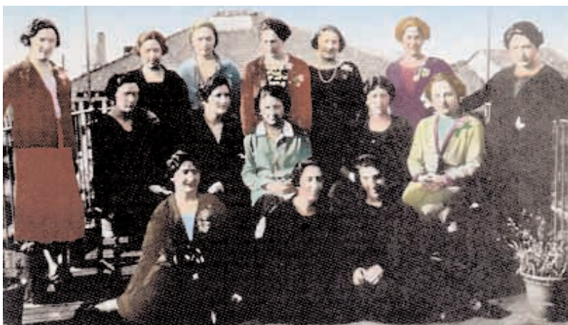
Euskal emakume idazleak, 1908-1936.

Berandukoa da euskal literatura. Eta urria. Gizonezkoena gehienbat. Elizgizonena, neurri handian. "Urria, berankorra, ñaño-antzekoa izateaz landa, badu beste makur nabarmena: txit mugatua izan dela, erlijio edo hobeki eliz-arazoetara iraulia gehienbat luzaroko mendetan" idatzi zuen Koldo Mitxelenak Klasikoak izeneko bildumaren aurkezpenean.