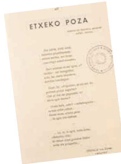
Yakintza aldizkarian argitaratutako poesia.

Bizitzaren azken aldian, 80ko hamarkada aurrera zihoala, Ez zaitez Gemikara joan, Lauaxeta poema luzea argitaratu zuen.