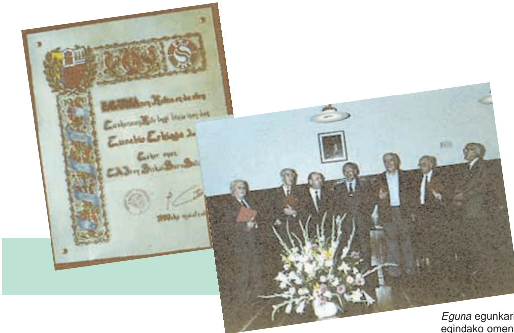
Eguna egunkariko idazle eta laguntzaileei egindako omenaldian.

"Gainerako euskaldunontzat ain berezia duen Bizkai-euskeraz, Lekeitioko itz-esaera jatorretan blei (ut dicunt) ageri den euskeraz, azaldu digu Erkiagak Lekeitioren edertasuna. Alde onetatik ene ustez, eztio batere zorrik Domingo Agirreri, eziña badirudi ere, ez jatortasunean ez aberastasunean."