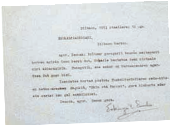
1953. urtean Euskaltzaindiari zuzendutako gutuna urgazle izendatzeagatik eskerrak emanez

Hamabost silabatako pareadoetan idatzia, Erkiagak egoeratik gora egin, 113 du, giza-saminaren adierazpide bihurtu arte.