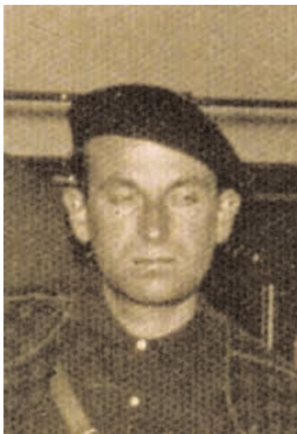
Lauaxeta soldadu jantzita

Euskal letragintzan Erkiagak egin duen lan sakon zabalean berebiziko tokia hartu dute bere sei nobelek. Edozein idazleri jarraipena eskatu ohi zaio bere lanak aurrerapidea izan dezan. Erkiaga ia berrogei urtetan aritu da lanean, kontakizuneko alorrean idazkera eta mundu ikuskera propioa lortu arte, eta hori gure historiak ezagutu duen arorik ilunenetan.