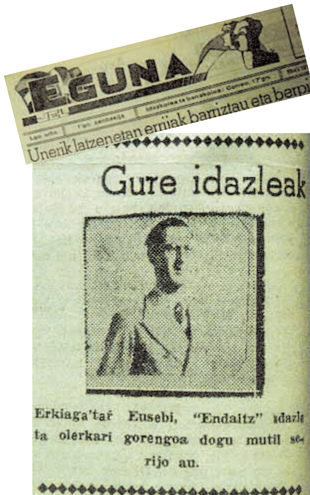
Eguna egunkarian idazleen argazkiak ateratzen zituzten noizik behin.

Lehiaketara bidalitako lan guztiek ez bazuten ere maila gorena lortzen, Erkiagaren estilo sotil horren agerbide dira. Erdi-mailako olerkaritzat zuen Aitzolek Erkiaga.