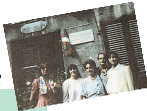
Lekeitioko Kultur Etxeari bere izena jarri zioten egunekoak.