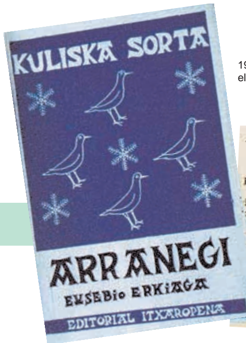
1958 Egan aldizkarian Mitxelenak argitaratu zuen Arranegi eleberriri buruzko kritika-artikulua.