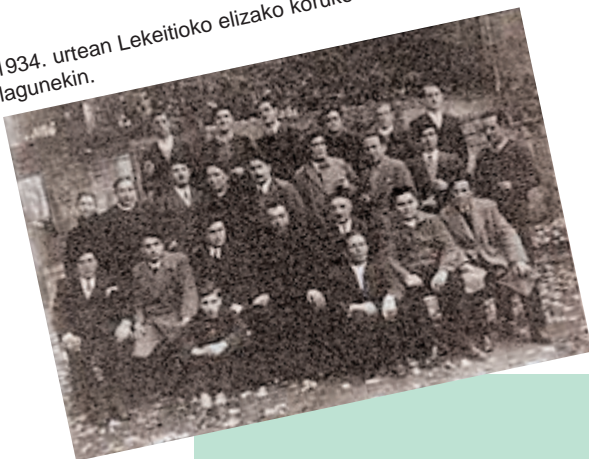
1934. urtean Lekeitioko elizako koruko lagunekin.