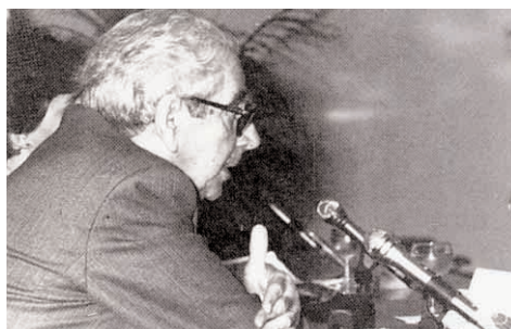
II. Euskal Mundu-Biltzarrean (1987).

Euskaltzaindiak mende erdia bete zuenean, 1968an, eman zitzaion Mitxelenari euskara bateratzeko oinarri-txostena egiteko agindua. Bai eta ederki bete ere (E. K).