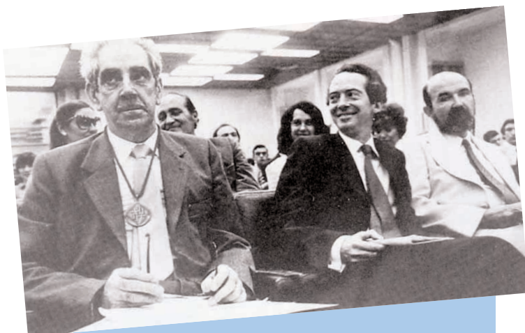
Argazkia: Barcelonako Unibertsitate Autonomoan, Doctor Honoris causa izendatu zutenean.

Gaurko Unibertsitatea, irekia eta publikoa nahi zuen.