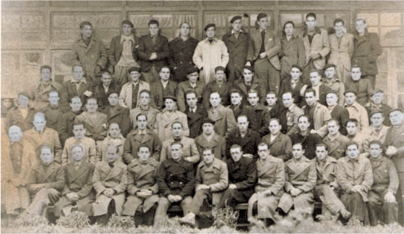
EUSKALDUNAK, BURGOS-eko PRESONDEGIAN. Lagunarte zabala bildu zen gerraondoko berehalako urteetan.