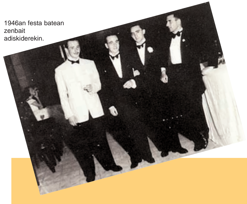
1946an festa batean zenbait adiskiderek.

Euskeraren alde Diputacioak jarri duen sail berri ontan lan egiten dutenak, abenduaren lendabiziko amabost egunetako jai egunetan Irañetatik asi eta Urdiain bitarteko erri guzitako umetxoak esamiñatuko dituzte, eta euskeraz itz egiten duten umetxo guziei sari ederra eman ere".