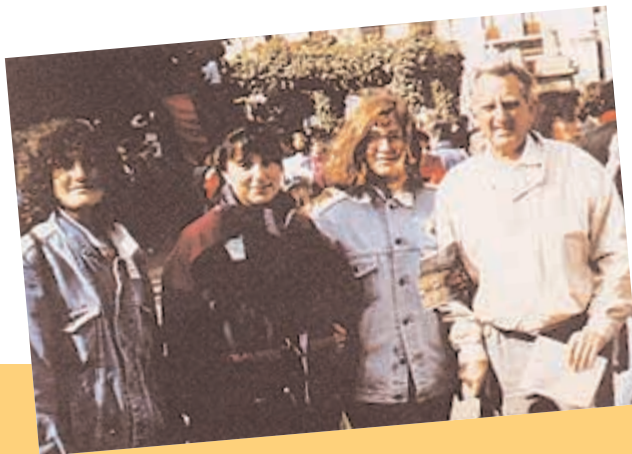
Atarrabiako Nafarroa Oinez-1991.