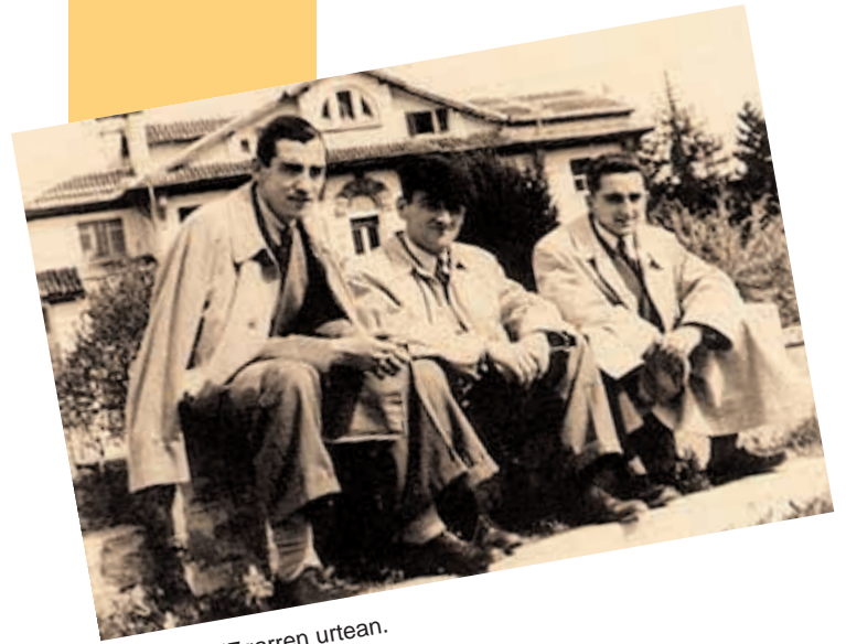
Iruñean 1947garren urtean.