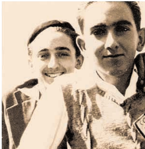
Oberena Elkarteko fundatzaileetarikoa bat izan zen.