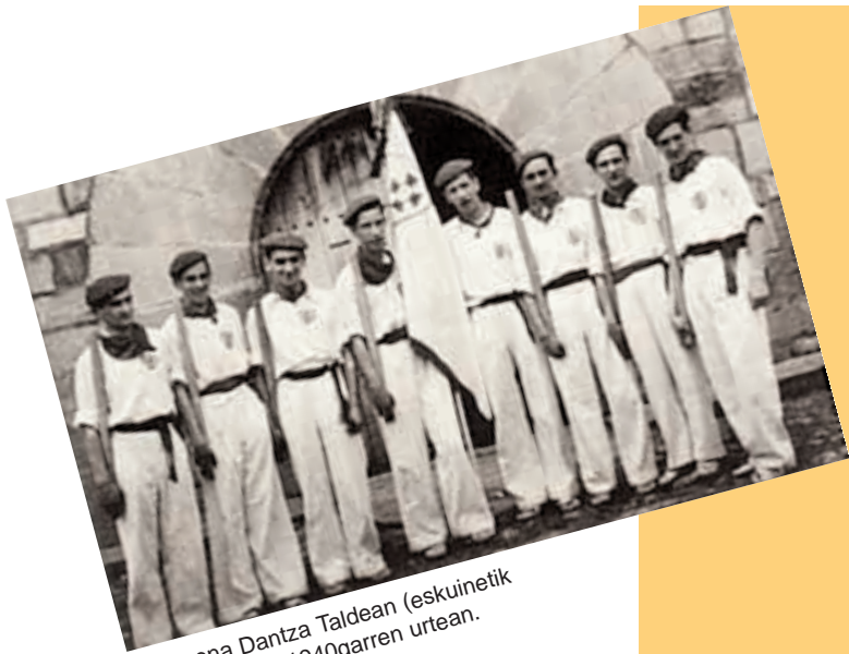
Oberena Dantza Taldean (eskuinetik hirugarrena), 1940garren urtean.