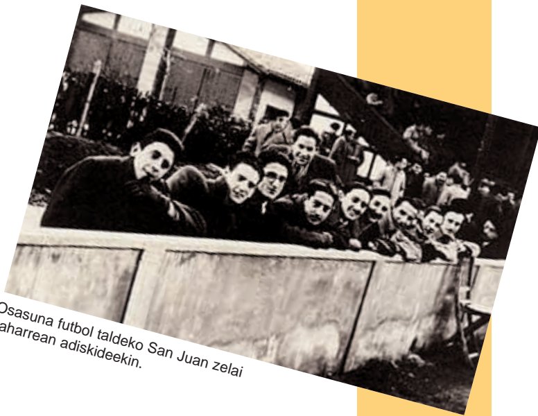
Osasuna futbol taldeko San Juan zelai zaharrean adiskideekin.