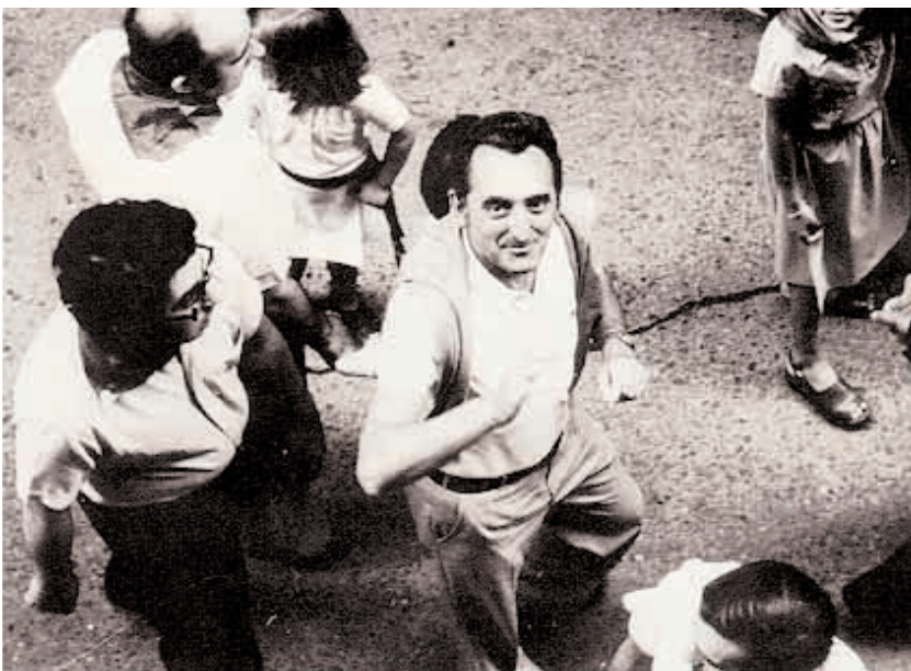
1976an, Iruñeko Sanferminetan.