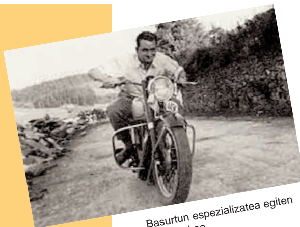
Basurtun espezializatea egiten zebilenekoa.