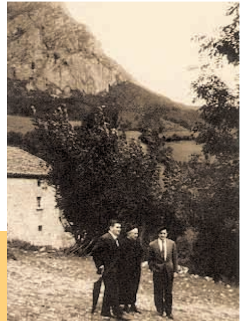
Gaintzan herriko apezarekin.

Hauxe izan zen lehen urratsa, eta hurrengo urteetan bide berari jarraitu zitzaion, euskararen benetako hizkuntz-errola egin arte. Hurrengo urteetan Burunda, Larraun, Basaburua, Aezkoa, eta gainontzeko