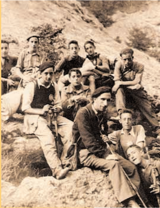
Urbasatik behera gerra bukatu zen urtean berean.