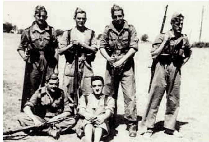
Soldadugoan, miliziatan Zamora aldean.