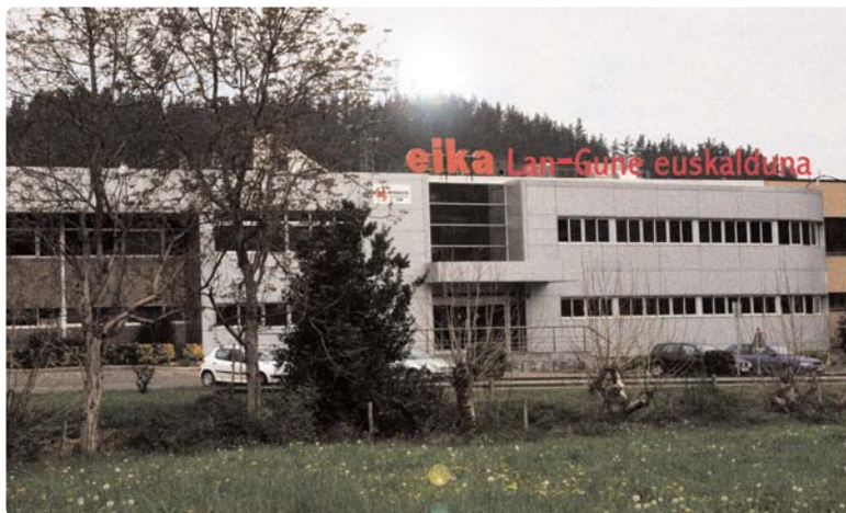
EI KA. LAN-GUNE EUSKALDUNA

Avant de quitter les lieux, nous jetons un dernier regard à l'entreprise, depuis notre voiture... Comment n'y avons-nous pas prêté attention à notre arrivée?