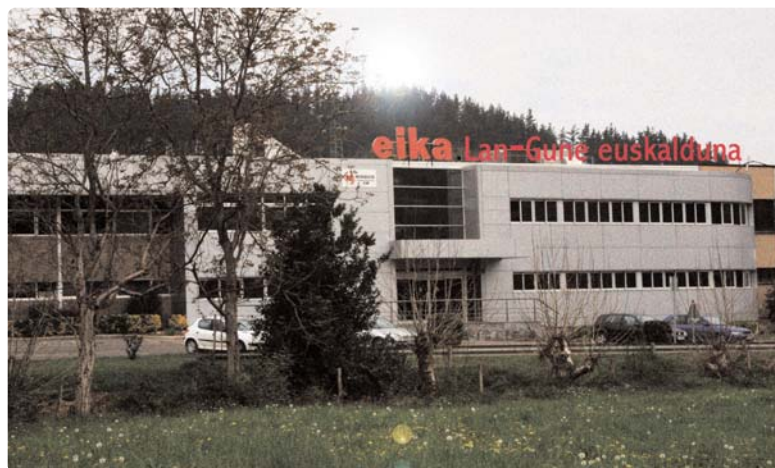
EI KA. LAN-GUNE EUSKALDUNA

Al abandonar la empresa, dirigimos una última mirada desde el automóvil... ¿Cómo no nos hemos fijado a nuestra llegada?