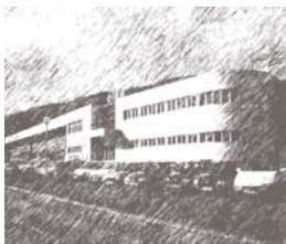
EUSKARAREN ESKULIBURUA Kapitulua: 7. NEURKETA ETA HOBEKUNTZA