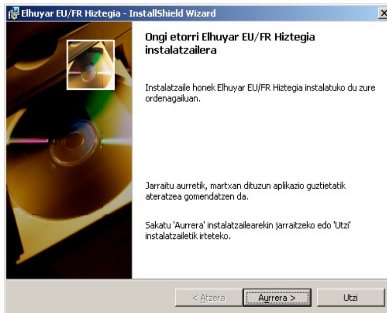
1. irudia: Instalatzailearen lehen pantaila

Elhuyar EU/FR Hiztegiaren plug-in-a testu-prozesadorean integratzeko, nahikoa da ElhuyarEUFRHiztegia.msi fitxategian bi aldiz klik egitea eta, hortik aurrera, instalaziorako laguntzaileak ematen dituen argibideak jarraitzea.